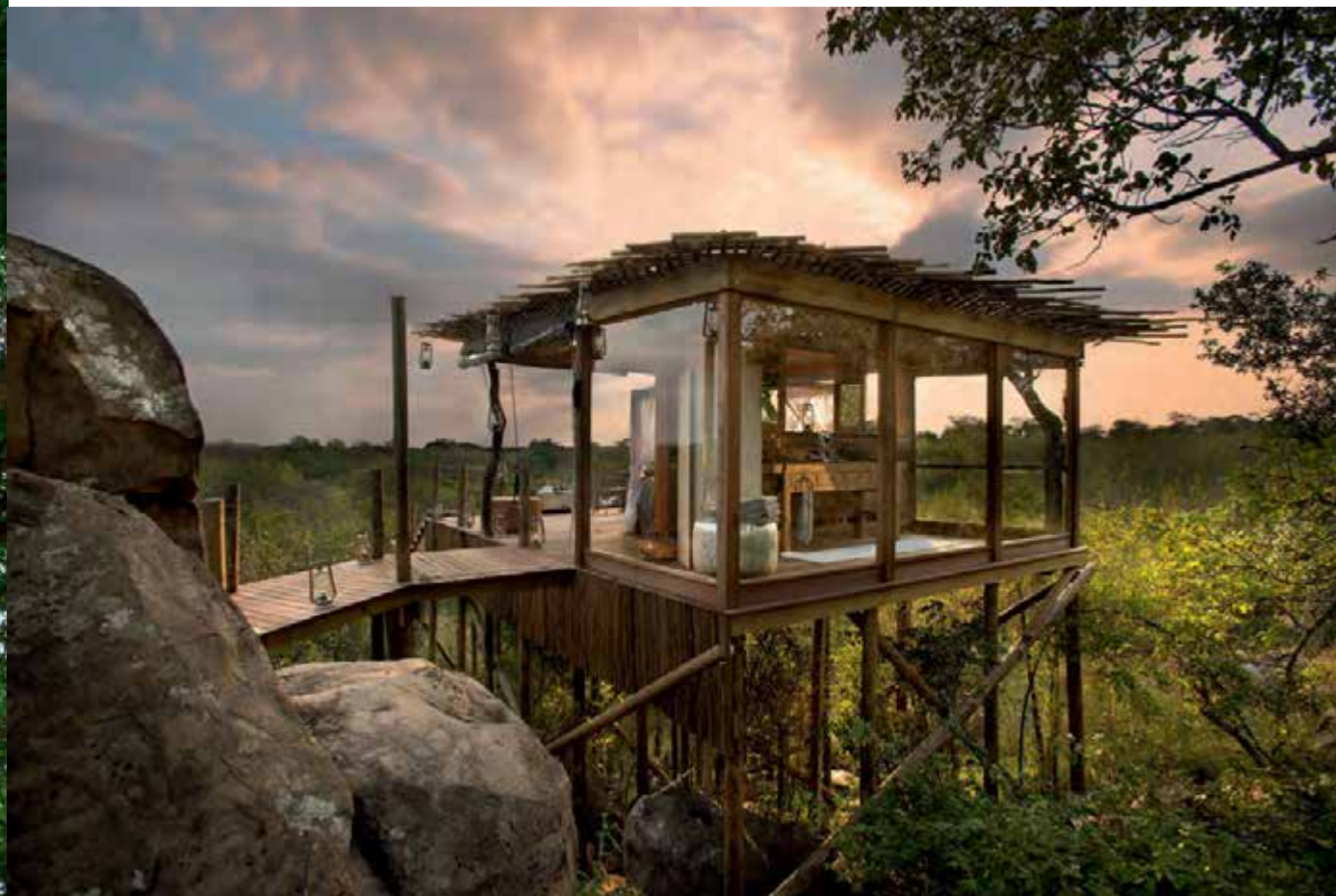
THE KINGSTON TREEHOUSE